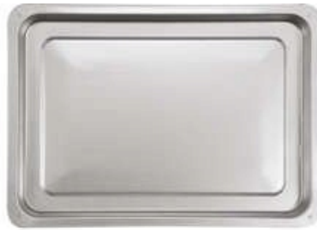
TRAY / TACA