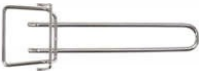
HANDLE FOR WIRE RACK / RĄCZKA DO RUSZTU