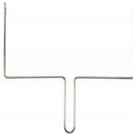
HANDLE FOR TRAY / RĄCZKA DO TACY